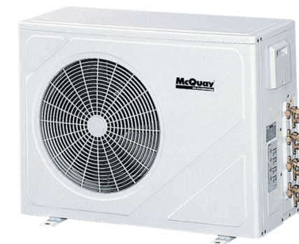
MMSH (мульти-сплит системы) для 2,3,4,5 внутр. блоков