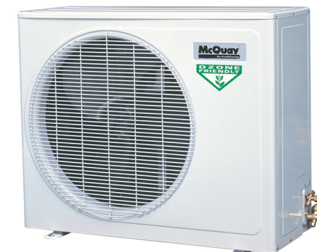
M4LC 030 - 050 C/CR (ХЛАДАГЕНТ R 407 C)